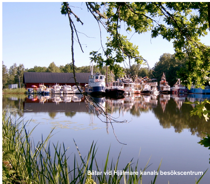
Båtar vid Hjälmare kanals besökscentrum

Slussarna öppnas och stängs fortfarande för hand precis som för 400 år sedan. Hjälmaren ligger 22 meter över Arbogaån, och nivåskillnaden är fördelad på nio slussar.